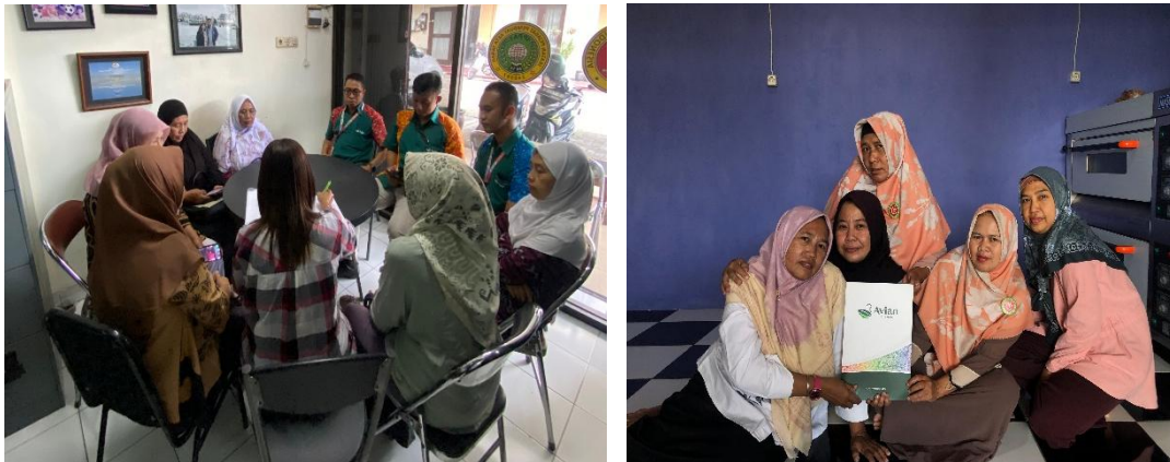
Gambar 4. Pembuatan Kelembagaan Formal Koperasi UMKM

menaungi kegiatan usaha mereka. Pada Agustus, tahun 2025, dibentuklah sebuah unit usaha bernama “Koperasi Kartini Mandiri Wadungasih, sebuah koperasi dengan jenis koperasi produsen sebagai wadah dua puluh anggota UMKM binaan. Dengan adanya pembentukan koperasi produsen menjadi sebuah penanda bahwa kelompok UMKM SIIIP dan ECO kini memiliki kelembagaan formal yang sah secara hukum sehingga lebih kuat dalam menjalin kemitraan dan mengakses peluang usaha. Terbentuknya struktur organisasi dengan pembagian tugas serta tanggung jawab yang jelas juga menjadi sebuah penanda bahwa kelompok UMKM telah melangkah pada kegiatan usaha yang lebih profesional.