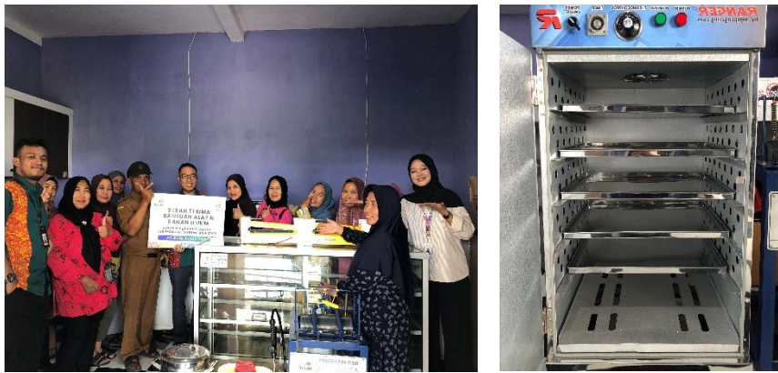
Gambar 3. Pemberian Dukungan Alat, Bahan, Kemasan Produksi

Sebagai contoh, pemberian alat oven pengering kerupuk didasarkan pada kebutuhan kelompok untuk menjemur adonan kerupuk yang lebih efektif dan efisien tanpa bergantung pada panas sinar matahari yang tersedia pada hari tersebut. Berdasarkan hasil wawancara, sebelum adanya alat oven pengering kerupuk, kelompok UMKM SIIIP memerlukan waktu 2-3 hari untuk menyelesaikan satu kali siklus produksi kerupuk kelor. Satu hari untuk pembuatan adonan dan dua hari lainnya untuk mengeringkan produk. Dengan adanya alat tersebut, saat ini proses produksi berupa pengeringan adonan kerupuk hanya memerlukan waktu 3-5 jam dan mampu meningkatkan hasil akhir kualitas produk akibat sempurna proses pengeringan.