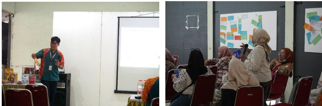
Gambar 1. Pelatihan Pembuatan Kemasan (Packaging) Produk