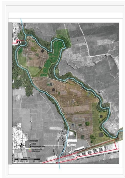
Gambar 5. Layout Plot Perhutana

Secara keseluruhan, Perhutana menempati posisi strategis dalam lanskap spasial Majalengka Utara yang tengah mengalami tekanan industrialisasi. Keberadaannya merepresentasikan bentuk counter-space yang menawarkan alternatif terhadap hegemoni pembangunan berbasis industrialisasi. Melalui praktik land banking berbasis keberlanjutan, konstruksi Hutan Keramat, serta penguatan perlindungan kultural, Perhutana membangun model pengelolaan ruang yang berorientasi pada keberlanjutan ekologis, keadilan sosial, dan kedaulatan budaya. Dalam konteks ekspansi Kawasan Industri Rebana yang semakin masif, Perhutana berpotensi menjadi rujukan bagi pengembangan gerakan konservasi dan praktik tata ruang yang lebih berimbang dan berkelanjutan di berbagai wilayah lainnya.