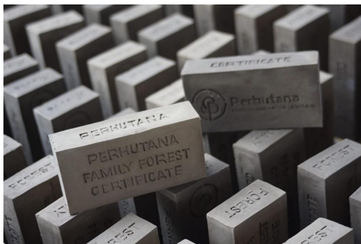
Gambar 4. Sertifikat Bata Perhutana

Istilah “Perusahaan” dalam nama “Perusahaan Hutan Tanaraya” juga merupakan bentuk subversi. Di Indonesia, pengelolaan hutan sering kali didominasi oleh Perhutani (BUMN) atau perusahaan HPH (Hak Pengusahaan Hutan) swasta yang ekstraktif. Dengan menamakan diri “Perusahaan”, JaF menantang definisi umum korporasi: bisakah sebuah perusahaan beroperasi semata-mata untuk keuntungan alam? Jawaban yang sedang ingin dibuktikan oleh Perhutana.