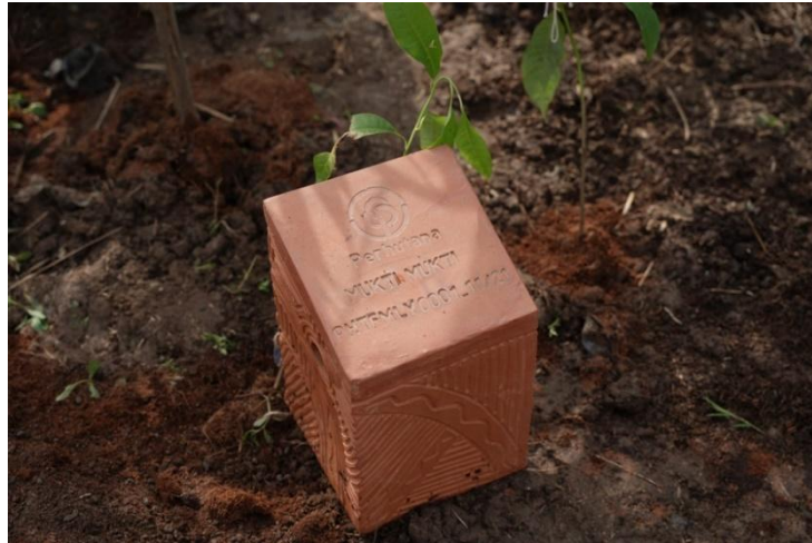
Gambar 5. Patok Tanda Perhutana