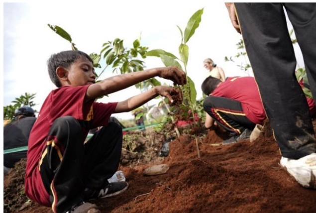
Gambar 3. Edukasi merawat ruang ekologis

Melalui pendekatan yang kompleks, Perhutana memfasilitasi pertukaran pengetahuan antara pengetahuan lokal dan pengetahuan ilmiah, sehingga menghasilkan model pengelolaan ruang yang kontekstual dan adaptif.