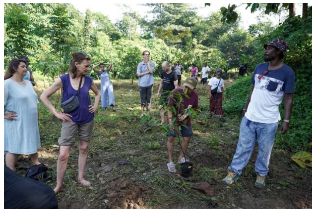
Gambar 4. Kunjungan pembelajaran bersama internasional